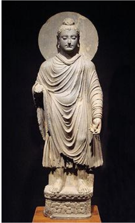
Una de las primeras representaciones de Buda Gautama.

Siddharta Gautama representa a la perfección el concepto de « búsqueda espiritual » según las antiguas creencias, sobre todo de naturaleza oriental. Es decir, el incansable esfuerzo interno o la catarsis que conduce a la unión liberadora con la divinidad o nirvana y por la que todos los seres humanos tarde o temprano se verán obligados a realizar ( autorrealización ) para alcanzar algún día iluminación , después, eso sí, de experimentar las necesarias y aleccionadoras reencarnaciones . Asimismo, la figura de Siddharta convertido finalmente en el Iluminado (o Buda ) viene a expresar la idea mística de que el camino hacia la propia luz y por consiguiente la obtención de la paz interior implica enorme sacrificio y suele comenzar con una provocadora e inquietante duda.