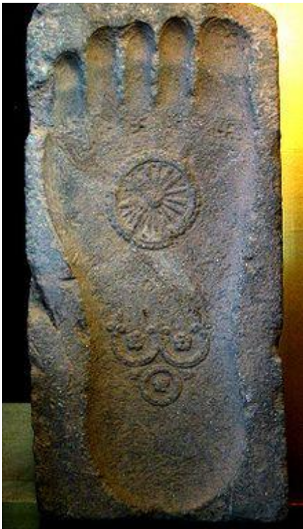
Huella del Buda.

Los primeros 29 años de la vida del príncipe Siddharta Gautama Buddha, transcurrieron completamente ajenos a toda actividad espiritual, siempre vivió con su familia. Los detalles de la infancia y juventud de Siddharta narran una vida rodeada de enorme lujo y comodidad. Recibió la mejor educación y formación posibles en su tiempo.