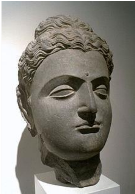
Busto de Siddharta Gautama de Gandhara , siglos I-II. Musee Guimet , París.

Al final de su periplo Siddharta caminó a un lugar llamado Bodhgaya , en el estado indio Bihar , hasta sentarse bajo la sombra de un árbol llamado bo o bodhi ( ficus religiosa ), considerado el árbol de la sabiduría.